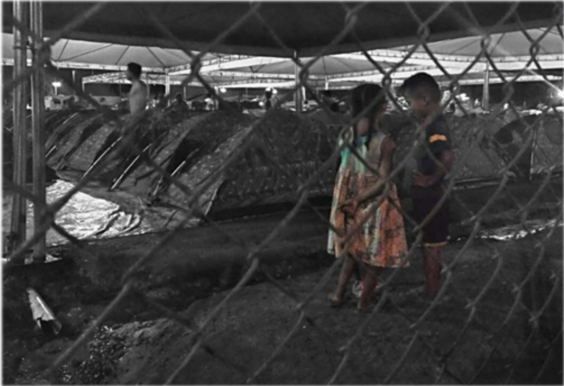
Área de pernocta para migrantes venezolanos cercano a La Rodoviaria en Boa Vista, estado de Roraima, Brasil. Militza Pérez (2019)