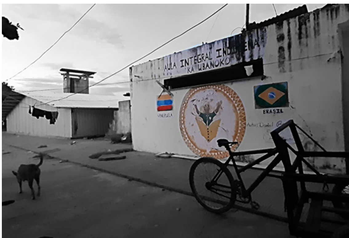
Aula Integral Indígena en el abrigo espontáneo Ka' Ubanoko en Boa Vista, estado de Roraima, Brasil. Militza Pérez (2020)

el 2021, lo cual constituye un reto y una responsabilidad para el Estado en su gestión nacional, y más aún, frente a la población en desplazamiento forzado, que incluye la atención de los venezolanos indígenas waraos, pemones, e'ñepás y kariñas. Son tiempos que tornan urgente la garantía de los derechos humanos independientemente de la condición migratoria.