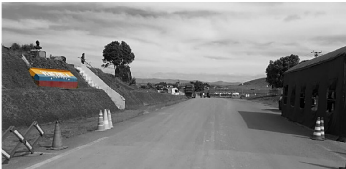
Monumento de las Banderas, zona fronteriza entre el Estado Roraima en Brasil y el estado Bolívar en Venezuela, Domingo Petot, 2020. Militza Pérez (2019)

cerradas oficialmente corriendo el riesgo de ser deportados al entrar por los caminos verdes 9 en el caso de Brasil y de permanecer en cuarentena obligatoria antes de poder seguir el camino a sus destinos en Venezuela.