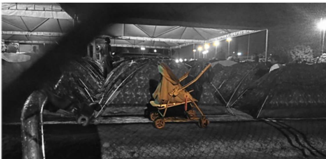
Área de pernocta para migrantes venezolanos cercano a La Rodoviaria en Boa Vista, estado de Roraima, Brasil. Militza Pérez (2019)

La estética de la hospitalidad normalizada, cambiaría rotundamente para mí el anhelo por una noche lluviosa, transformándose en una pesadilla húmeda que traspasará los techos de plástico y empantará los pisos de tierra, donde los refugiados intentan conciliar el sueño todas las noches, después de la espera en filas para entrar en el área de pernocta próxima a La Rodoviaria 8 Entre las familias se descubre un breve espacio de sutileza entre el amor y el sacrificio por la búsqueda de oportunidades. La inocencia de los niños resulta más que oportuna, al no percibir –de momento– la gran fragilidad de su situación.